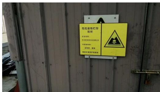
图 3-2 危废暂存间