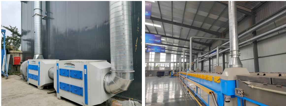
图 3-1 废气处理设施

本项目产生的废气主要为密封条制备废气。项目在每台密封条挤出机微波加热段出料口设置一台集气罩对产生的有机废气进行负压收集（约 7000m 3 /h），共用 1 套两级活性炭吸附装置，对收集的废气处理达标后由 15m 高排气筒排放。集气罩对有机废气捕集率以 90% 计，两级活性炭吸附装置对 VOCs 的处理效率以 80% 计，项目密封条制备废气 VOCs 排放浓度和速率均能满足《四川省固定污染源大气挥发性有机物排放标准》（DB51/2377-2017）表 3 中橡胶制品制造行业排放标准。